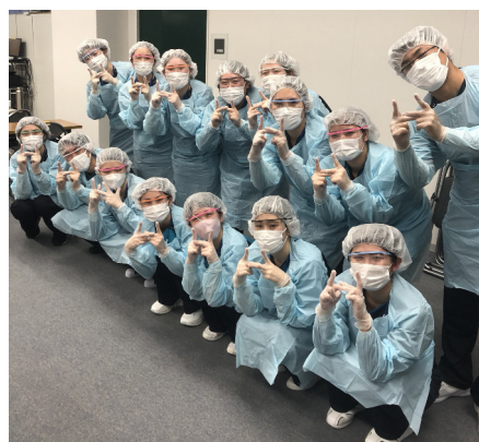
実技研修後の様子

2日目以降は久康会役職者や委員長による講義が開催されました。実技演習やグループワークも取り入れた研修形式により、少しずつ同期との仲を深めている様子でした。