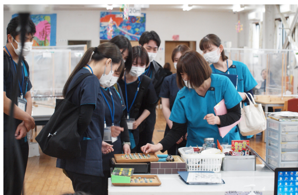
通所介護事業所 見学

研修中、法人施設である介護老人保健施設等の施設見学へ行きました。各施設長からの説明をうけ、住み慣れた地域で自分らしい暮らしを続けることを目的とした「地域包括ケアシステム」について理解を深める事ができたのではないのでしょうか。