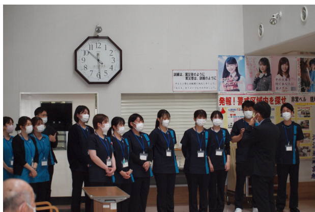
介護老人保健施設 見学