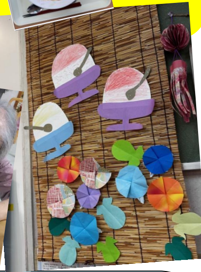
壁飾りは協力して作りました

令和6年7月25日、26日に夏祭り行事で屋外で水鉄砲での的当てをしました。 良い天気でしたが、外でのレクリエーションは暑かったですね🍀🍀 26日は、トトロみのる園の夏祭りを覗いてマツケンサンバ（スタッフ）のステージを楽しみました。