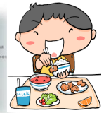
栄養科による食事に関するアンケート