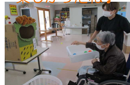
鬼の口にボールを投げたよ☆三